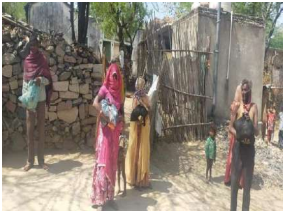
Distribution at Udaipur, Rajasthan