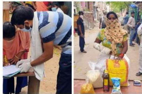
Distribution at Belgaum