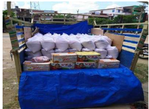
Ready for distribution at Papamkuppam, TN