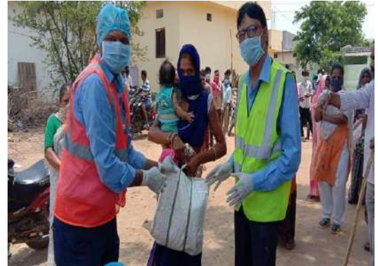
Distribution of Food Supplies at Dundigal