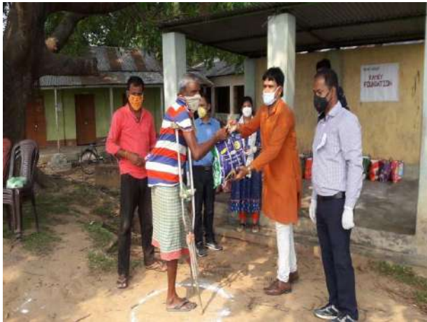
Distribution of Food Kits at Tripura