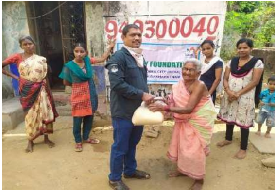
Distribution of Rice at Visakhapatnam