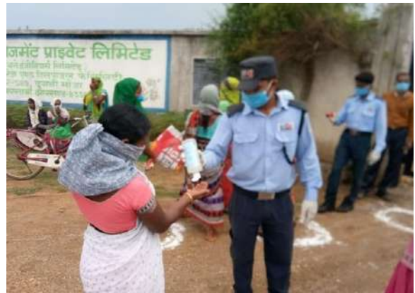
Sanitization Procedure for taking supplies, Jharkhand