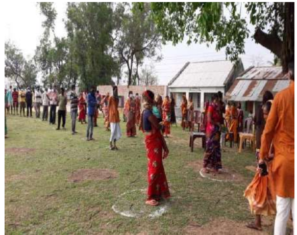
Social Distancing while collecting kits