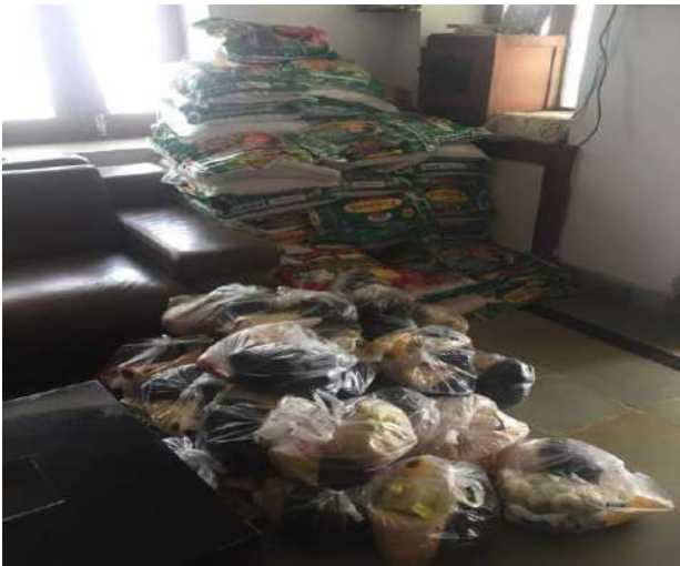
Food Kits ready for distribution