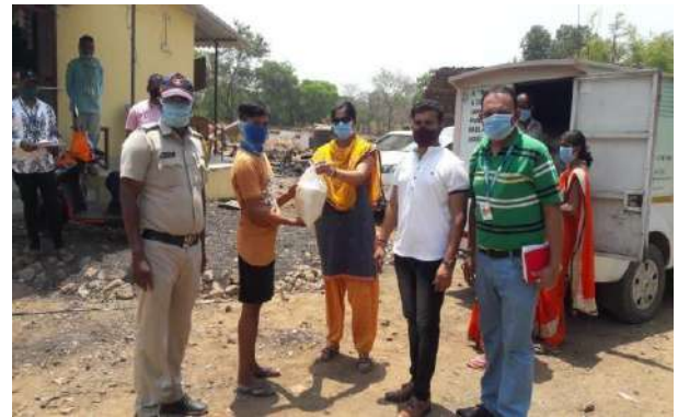
Distribution at Taloja