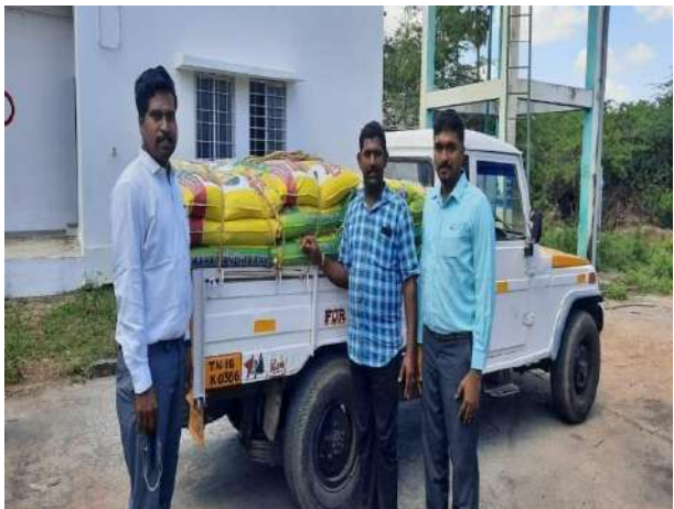
Groceries ready for distribution at Chennai