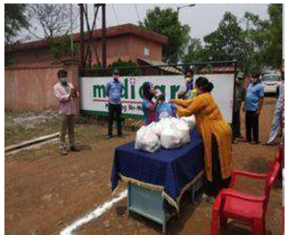
Distribution of Groceries at Durgapur