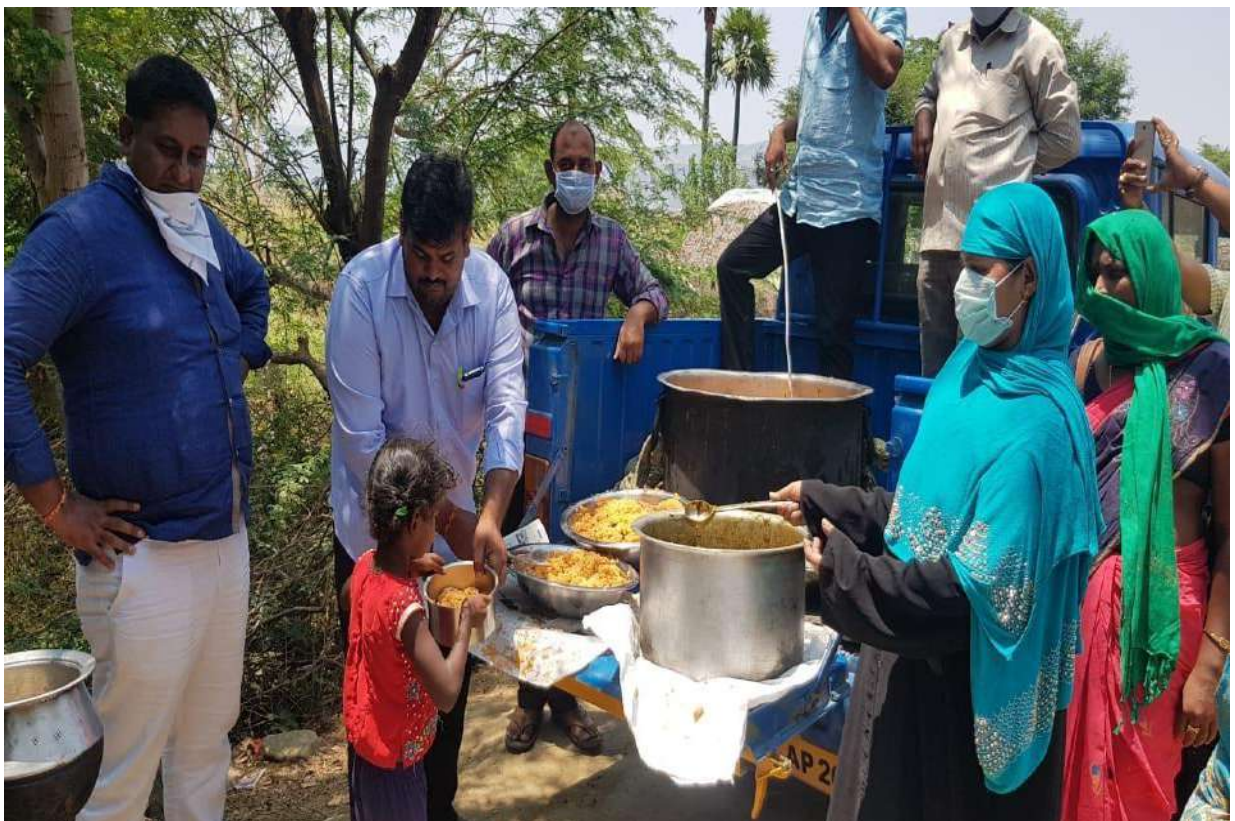
Distribution of Food at Nellore