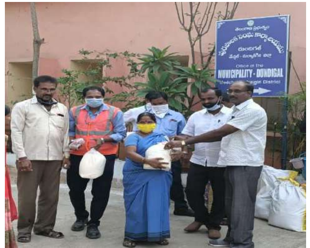
Grocery distribution for Municipal workers

The following diagrams shows the details of the budget spent and beneficiaries covered