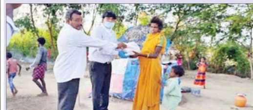
గిరిజనులకు నిత్యవసర సరుకులు పంపిణీ చేస్తున్న దృశ్యం