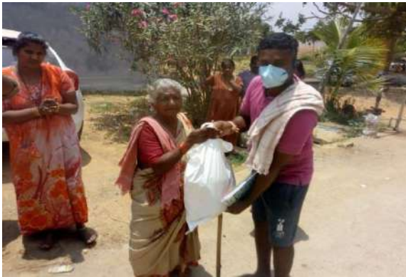
Distribution at Timmanayakanahalli, Karnataka