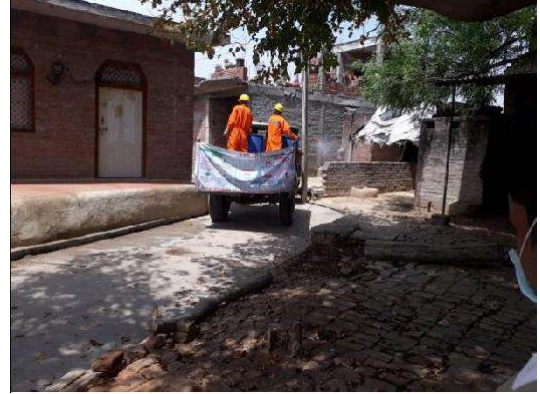
Sanitary Workers disinfecting the villages with Sodium Hypochlorite in Akbarpur, Uttar Pradesh