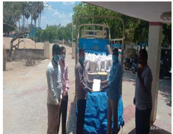
Groceries distribution at Madurai BMW Site