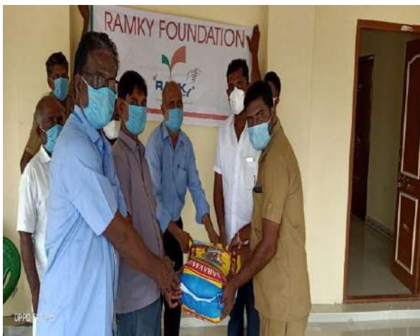
Distribution of Rice at Salem BMW Site