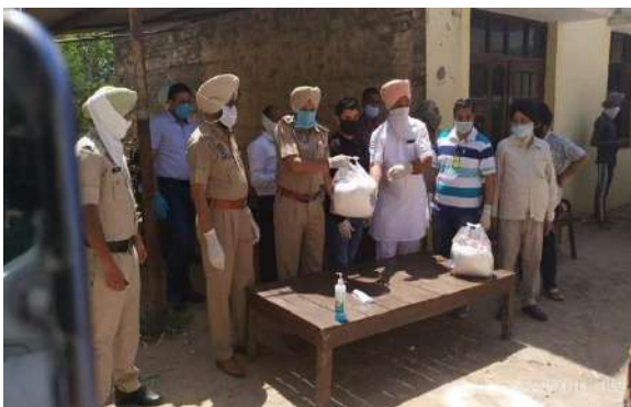
Distribution of Rice at Nimbua